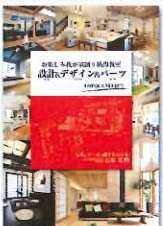
著者：インホーム代表 石原宏明

家研出版 お楽しみ我が家創り納得教室 設計&デザイン&パーツ本 ご来場者にプレゼント