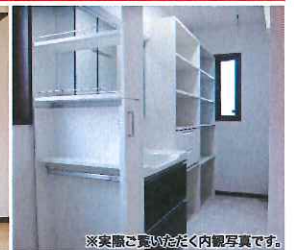
※実際ご覧いただく内観写真です。

家研出版 お楽しみ我が家創り納得教室 設計&デザイン&パーツ本 ご来場者にプレゼント